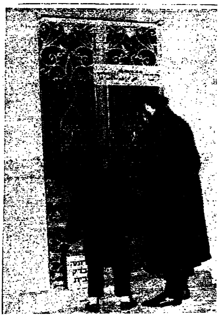
اب يهودي وابنه امام قبر يعقوب في الحرم الابراهيمي الشريف. لاحظ انهما يتقلدان الاحدية في الحرم.